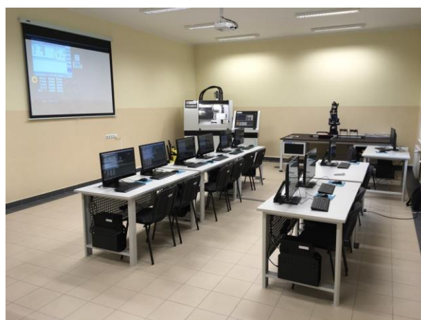
Widok dwóch oddzielnych, pracowni EXPERT CNC (górze)