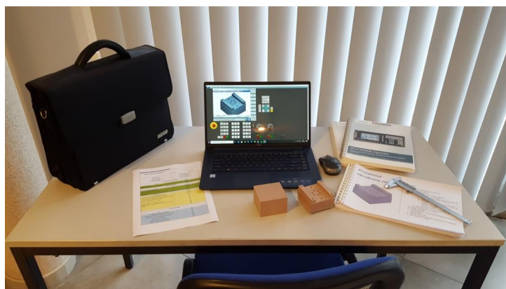
Widok pakietu pracy domowej ucznia.

Producent i dostawca (od 1996 roku) obrabiarek edukacyjnych CNC i robotyki dla edukacji: